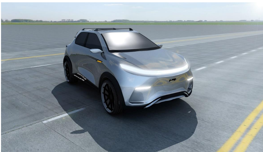
Źródło własne - Biomass Energy Project S.A. . Projekt SUV-a z napędem elektrycznym